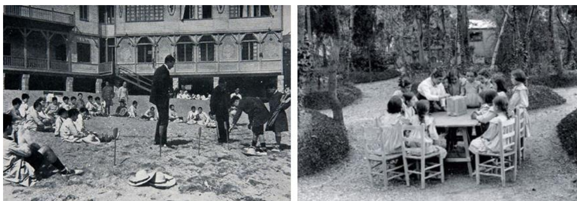
La escuela de mar y La escuela de bosque de Barcelona. Años 20 del siglo XX

Hoy, 16 de enero de 2022, los equipos humanos de las escuelas están luchando y haciendo lo imposible para adaptarse y resistir con resiliencia. Un reconocimiento que nos deja muchos deberes a todos, pero sobre todo recordando que hace 100 años "Les Escoles del Bosc" acogieron a los niños en tiempos de pandemia con un planteamiento renovador de calidad y de recursos para hacer una escuela de todos, y para todos, cerca de la naturaleza.