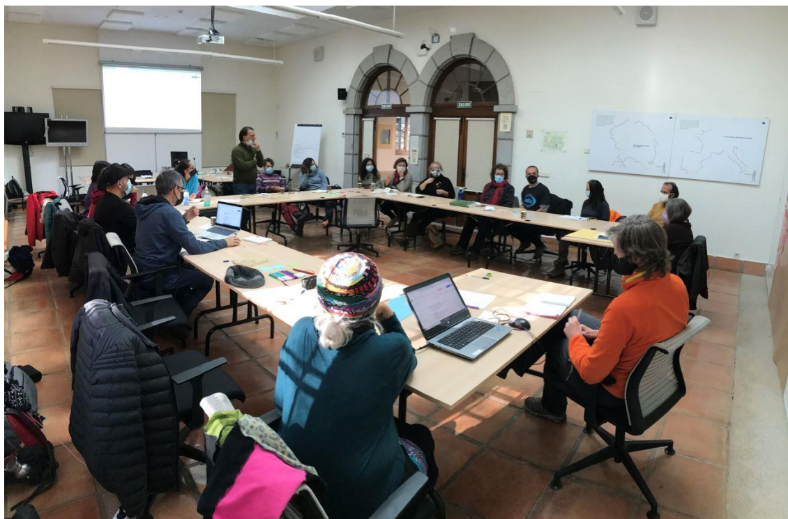
Creación del seminario del CENEAM Reconectar con la naturaleza en Valsaín (Segovia) Noviembre 2021

Recientemente también hemos participado en Segovia en la creación del grupo de trabajo "Reconectar con la naturaleza" 3 del Centro Nacional de Educación Ambiental CENEAM. Un colectivo de personas y entidades muy diversas que están trabajando para avanzar en la difusión de las distintas prácticas de reconexión con la naturaleza. El seminario es respetuoso con los procesos y las formas de pensar, y pone de manifiesto la singularidad de cada territorio y de las personas que acompañan la transformación de sus espacios.