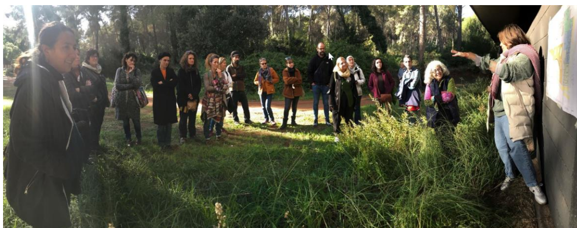
Grupo de trabajo Com està el pati de l'AM Rosa Sensat visitando una futura escola bressol del Ayuntamiento de Gavà (Barcelona)

Durante estos dos años hemos estado conectados virtualmente como grupo de trabajo "Cómo está el patio" de la asociación de maestros Rosa Sensat. Hemos tenido la oportunidad de ir articulando la formación y el debate interno. Cada uno con su especialidad ha aportado conocimiento al repensar y proyectar sus propios pensamientos en su territorio. Hemos tenido la suerte de poder compartir y debatir aprendizajes en distintas áreas, lo que nos ha enriquecido a todos. Nuestra valoración subjetiva es buena y podemos ver cómo gestionar la transformación del espacio exterior desde distintos ángulos. En muchos casos, con pequeñas transformaciones en los patios, hemos pasado de tener la oferta del juego de pelota y más concretamente de fútbol, a tener una amplia oferta con diversidad de propuestas. Pero debemos saber cómo gestionar las polarizaciones y cómo podemos ir desdibujando las etiquetas que separan a los diferentes colectivos. El poder gestionar la vegetación introducida en los patios, cultivarla en el sentido estricto de la agronomía, hacer que la respete la comunidad y que se cuide, también son importantes retos. Debates y conversaciones que poco a poco debemos ir afinando o reformulando. En estos dos años las demandas de ayuda se han ido multiplicando y las hemos ido acogiendo, coordinando y gestionando de la mejor manera que sabíamos. Toda esta información se puede consultar en la web de Rosa Sensat 1 .