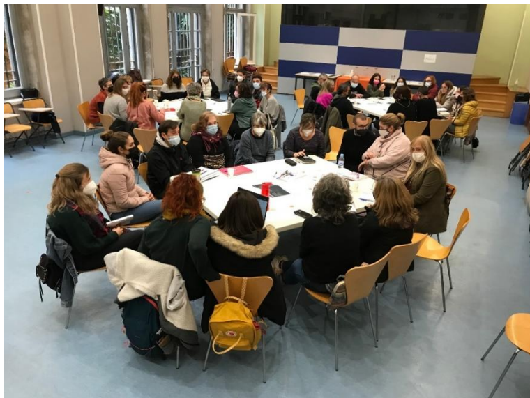
Jornada de trabajo en la AM Rosa Sensat dentro del proyecto Transformemos los patios del Consorci d'Educació de Barcelona

considerarse espacios de vida y de aprendizaje. El proyecto “ Transformem els Patis ” 7 del Consorcio de Educación de Barcelona se empezó a implementar hace un par de años con la transformación de una docena de patios en refugios climáticos. Ahora ya está en su tercera fase de aplicación a un ritmo de quince escuelas cada año. En 2030 se prevé haber transformado todos los patios de los centros públicos de la ciudad.